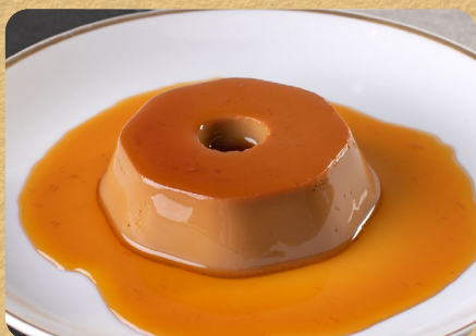
PUDIM 150G 15,00

Opções: escocês, palla de neve, brigadeiro, menta, nozes e tartufo