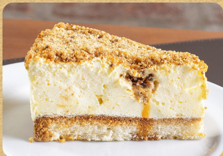
TORTA DE SORVETE COLORÊ 95G 14,50

Opções: floresta negra, nozes e crocante