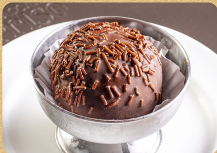
SORVETE COLORÊ BOMBOM 80G 14,50

Opções: floresta negra, nozes e crocante