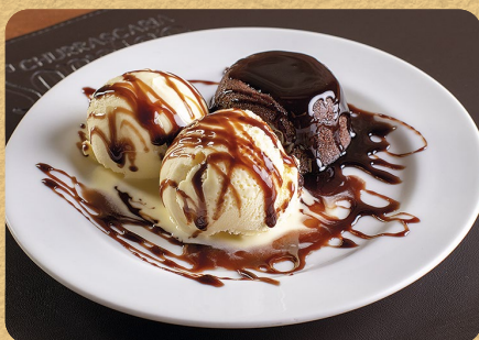
PETIT GÂTEAU 200G 26,90