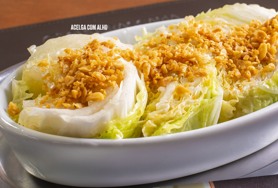
ACELGA COM ALHO