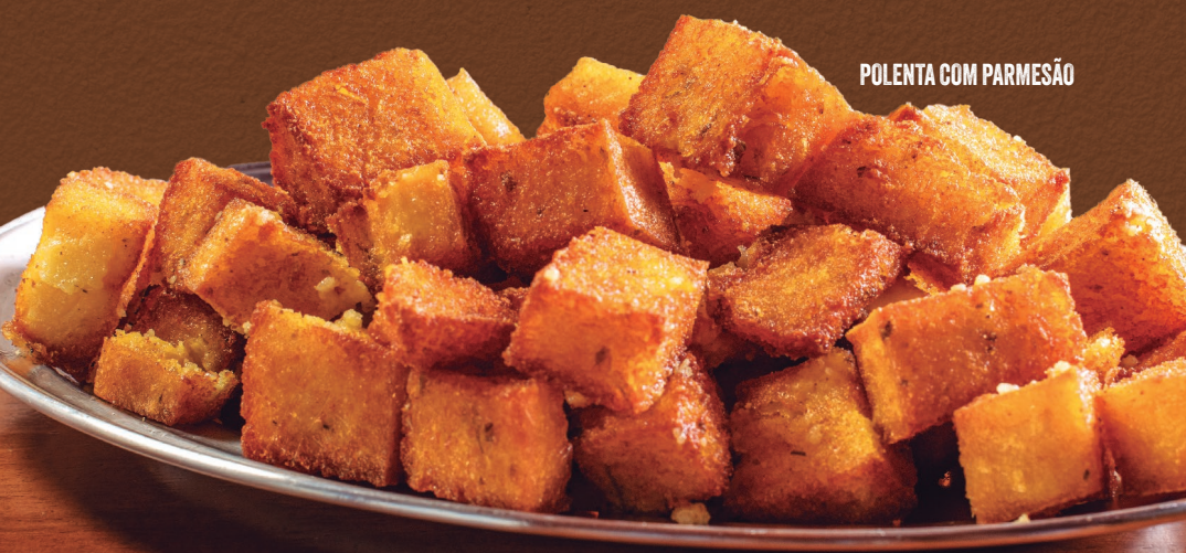
POLENTA COM PARMESÃO