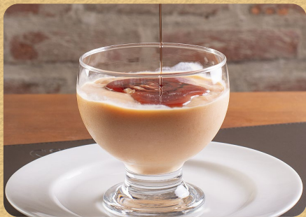
CREME DE PAPAIA C/ CASSIS 400ML 25,90