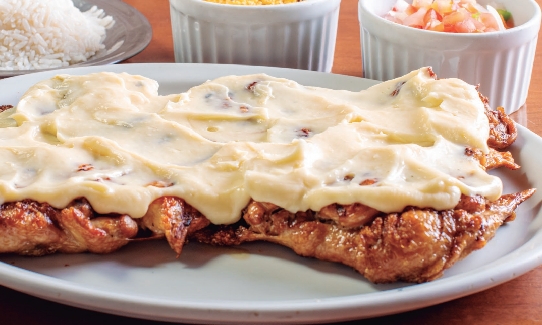
FRANGO DESOSSADO COM CATUPIRY