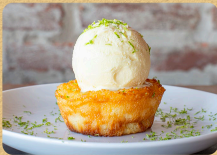
COCADA CREMOSA 150G 25,90