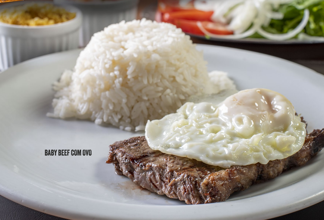
BABY BEEF COM OVO