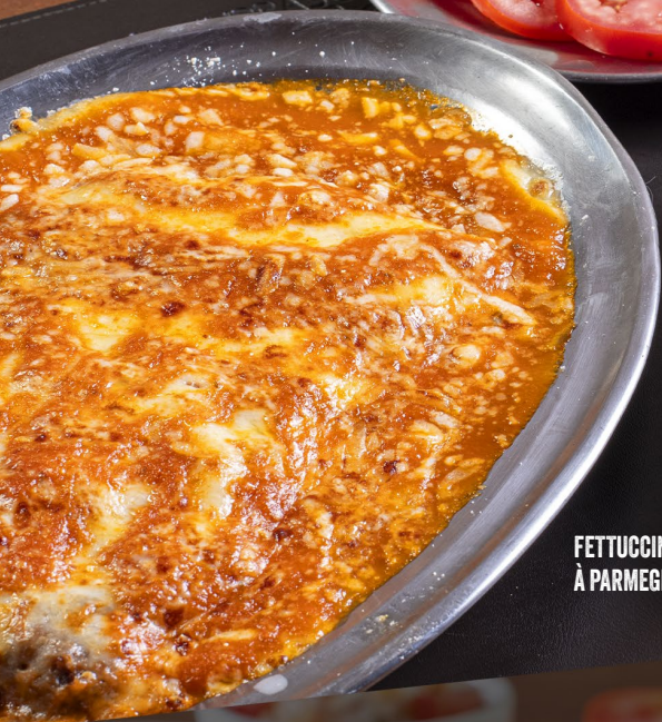
FETTUCCINE COM MIGNON À PARMEGIANA