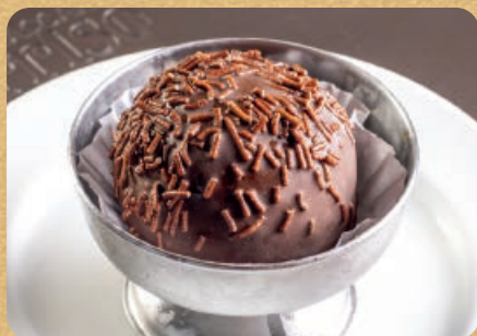
Sorvete Colorê Bombom 80g 16,00

Opções: floresta negra, nozes e crocante