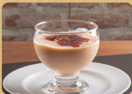
Creme de Papaia com Cassia 400ml 27,00