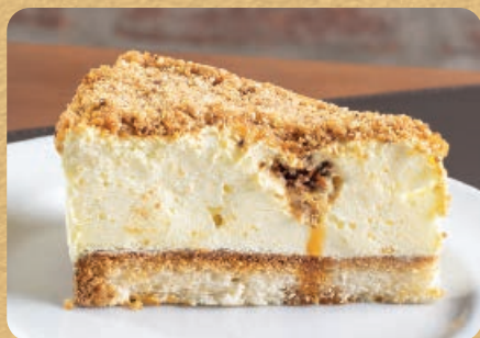
Torta de Sorvete Colorê 95g 16,00

Opções: floresta negra, nozes e crocante