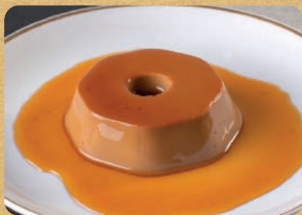
Pudim 150g 15,00

Opções: escocês, palla de neve, brigadeiro, menta, nozes e tartufo