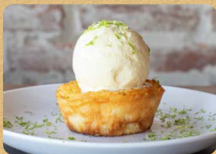
Cocada Cremosa 150g 29,00