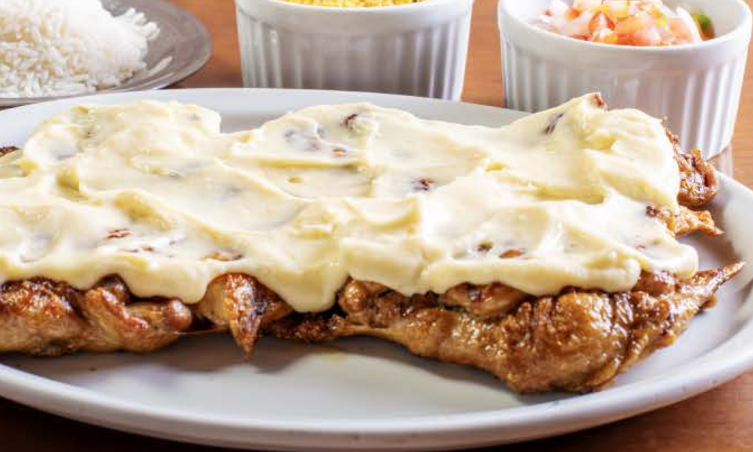
FRANGO DESOSSADO COM CATUPIRY