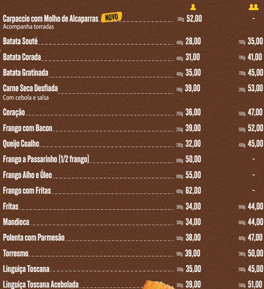
POLENTE COM PARMESÃO