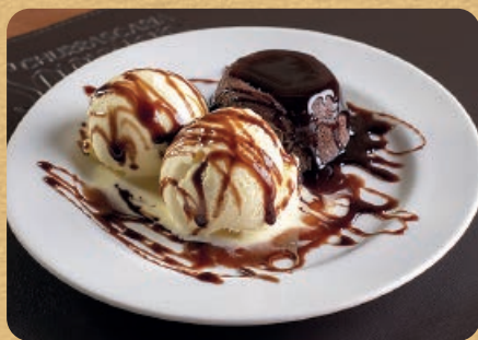
Petit Gâteau 200g 28,00