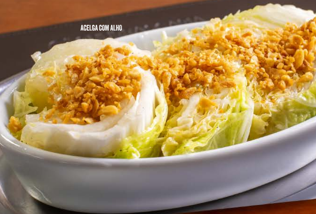
ACELGA COM ALHO